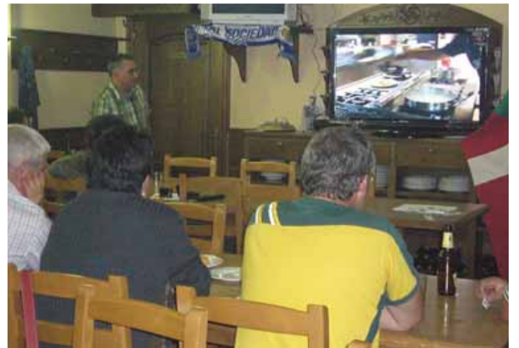
Sukaldariak prestatzen ari direna jantokian ikus daiteke, kamara batek telebista erraldoian zuzenean emititzen duelako.

A.B. Etorri den jendea oso gustora dago, lehen eguna izanik nahiko pozik gaude.