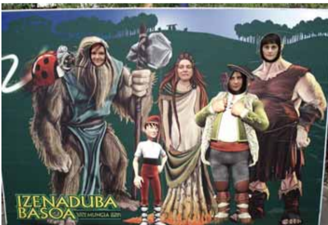
Urtean zehar irteerak egin ohi dituzte Karrikako ludotekakoek.

2009-2010. ikasturtearekin batera aisialdi ekimenak martxan jarri dira. Horien artean “Larunbatean euskaraz” Karrikako ludoteka. 3-12 urte artekoek zuzenduta dago eta izenak dioen bezala larunbatero zabalik dago goizeko hamarretatik eguerdiko ordubatak arte.