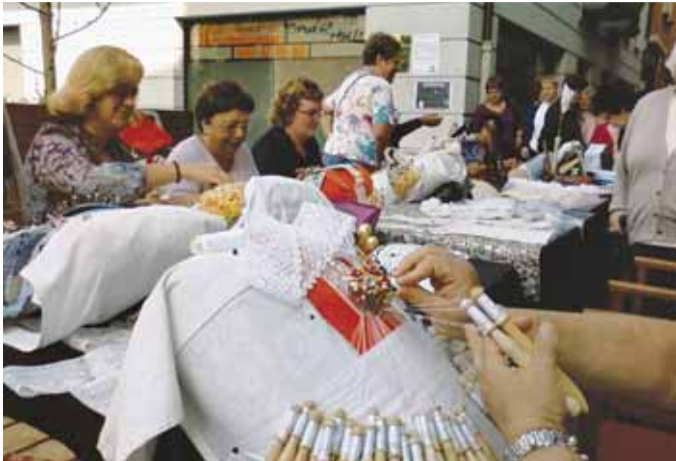
Ehaziri edo bolilloen erakustaldia, Kale Nagusian.

Lehen ahaleginean ehazirien eta euskal jantzien erakustaldia eguraldiak galerazi bazuten ere, Salkinekoek ez zuten etsi. Bigarren eta azken ahalegina aurreko larunbat goizean izan zen. Eta irudietan ikusten denez, ikusmin handia piztu zuen oinezkoen artean.